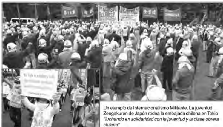
Un ejemplo de Internacionalismo Militante. La juventud Zengakuren de Japón rodea la embajada chilena en Tokio "luchando en solidaridad con la juventud y la clase obrera chilena"

Hay que recuperar el internacionalismo militante en la clase obrera mundial