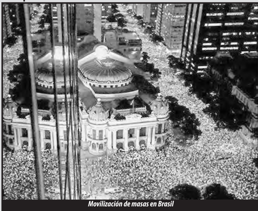
Movilización de masas en Brasil