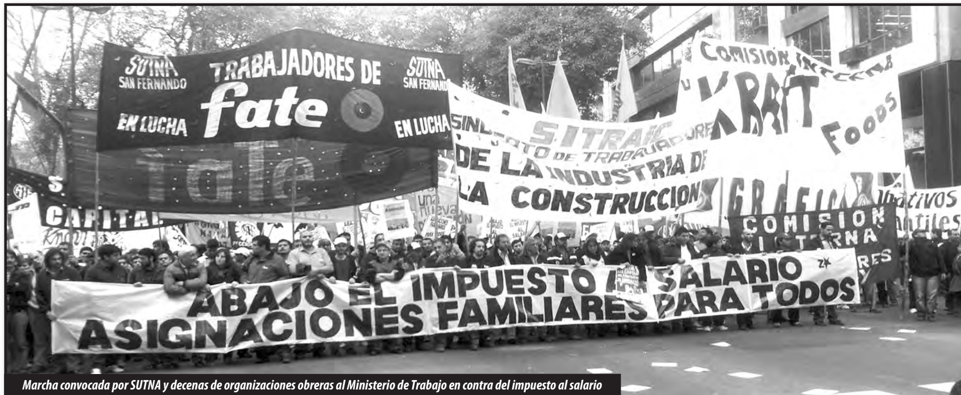
Marcha convocada por SUTNA y decenas de organizaciones obreras al Ministerio de Trabajo en contra del impuesto al salario