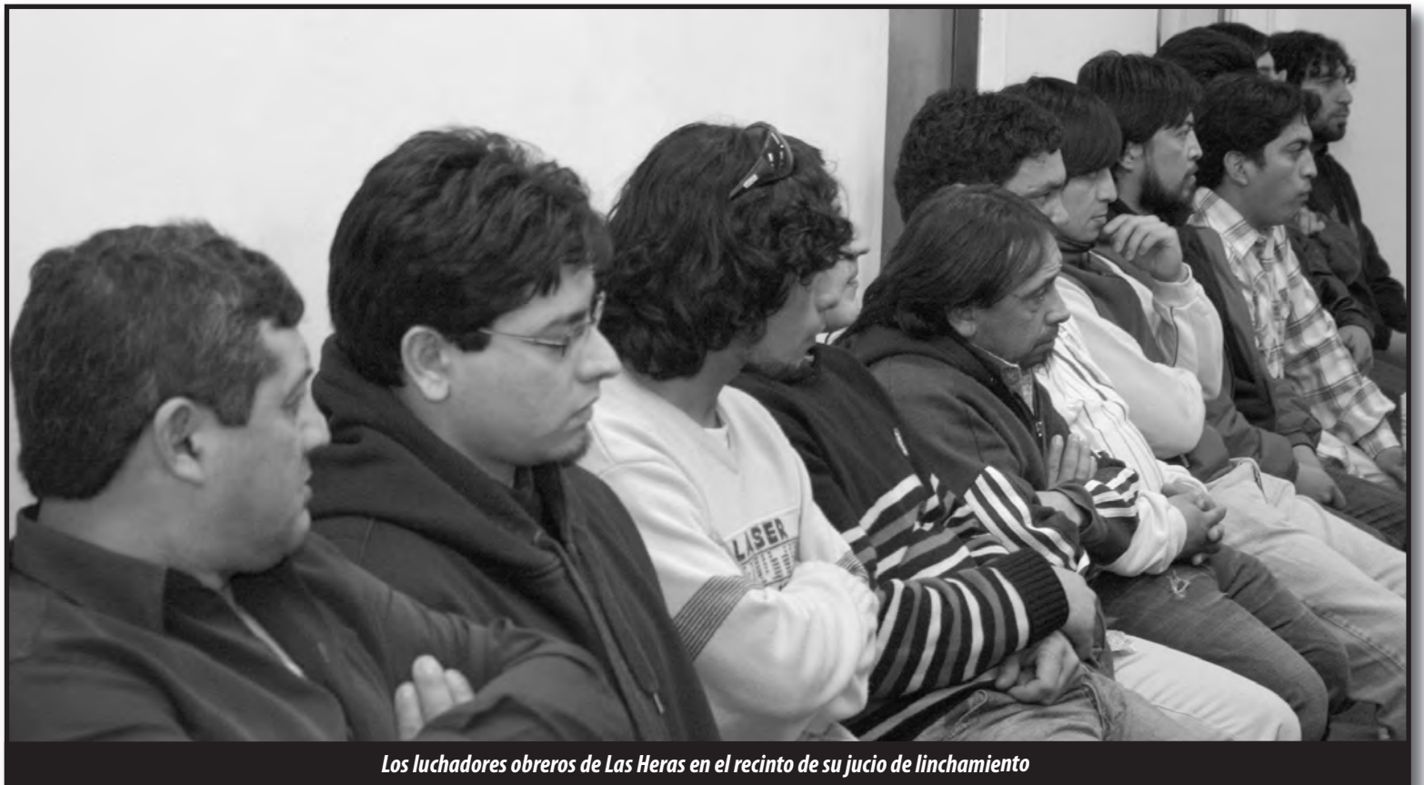
Los luchadores obreros de Las Heras en el recinto de su juicio de linchamiento

“testigos policiales” de las pruebas supuestamente encontradas en las casas allanadas de los obreros; la negación de oficiales del servicio de inteligencia de haber visto a ninguno de los acusados el día de los acontecimientos en cuestión; la aceptación inclusive de que se tomaron datos de los procesados desde las guías telefónicas: demuestran que estamos ante una vil patraña montada por los directorios de las petroleras, dándoles órdenes a policías corruptos y asesinos y a jueces que legitimaron este accionar perverso y cruel contra los trabajadores.