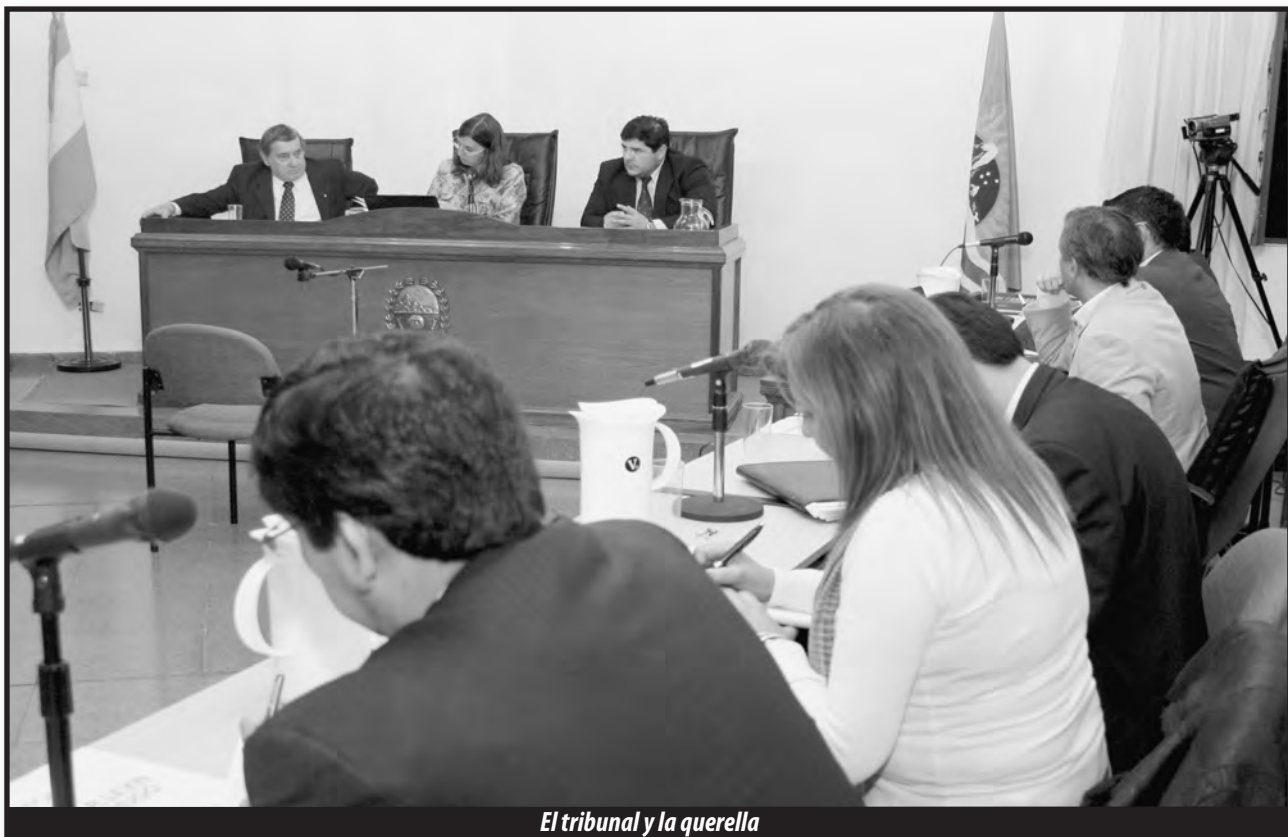
El tribunal y la querrela

Se sigue contradiciendo cuando por un lado afirma que todo lo hicieron luego de tres días y por un total de sesenta días, y por otro lado, ante la pregunta de "¿Recuerda el número de personas que había esa noche?" responde que había multitud en ese momento.