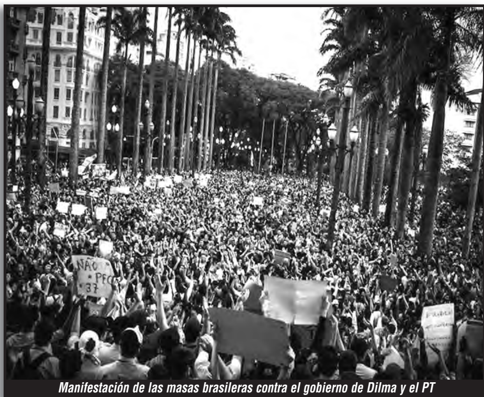
Manifestación de las masas brasileñas contra el gobierno de Dilma y el PT

Con la represión en Brasil y con 6.500 luchadores procesados en Argentina, se les cae la careta a los gobiernos bolivarianos: son todos represores, socios de las transnacionales y hambreadores del pueblo