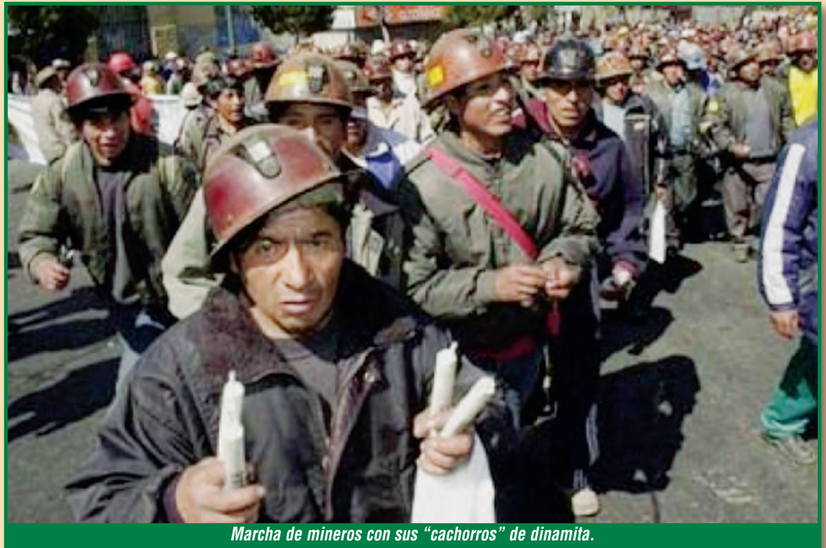
Marcha de mineros con sus "cachorros" de dinamita.

Lo que hay detrás de estas acusaciones sin fundamento es que ya las transnacionales imperialistas le han enviado la orden al gobierno de escarmentar a los mineros para que nunca más en Bolivia se vuelva a asomar el fantasma de la revolución de 1952. A eso le teme la burguesía y las transnacionales: a que los mineros volvamos a acaudillar nuevamente la alianza obrera y campesina y vuelva la revolución.