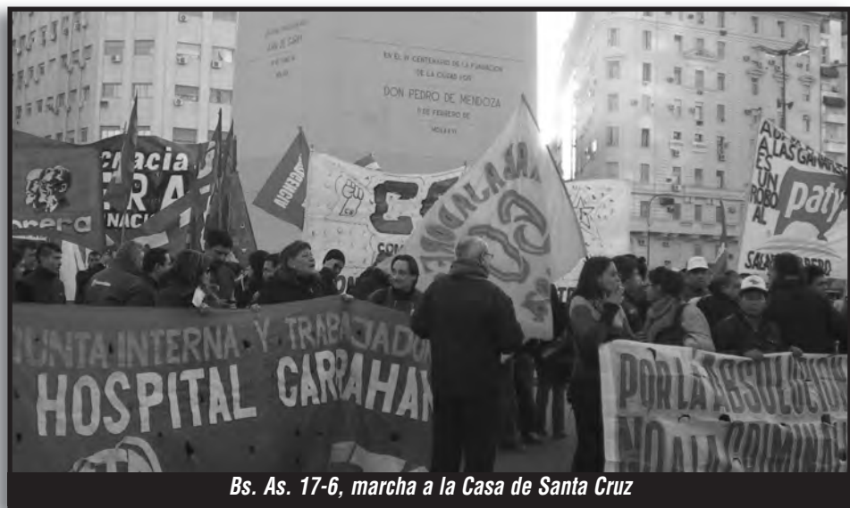
Bs. As. 17-6, marcha a la Casa de Santa Cruz

Repetimos, para nada sorprenden estas declaraciones de los diputados de la UCR. Si en 1919 en “La Semana Trágica” en Buenos Aires, con la casta de oficiales del ejército y los cajetillas de los estudiantes de