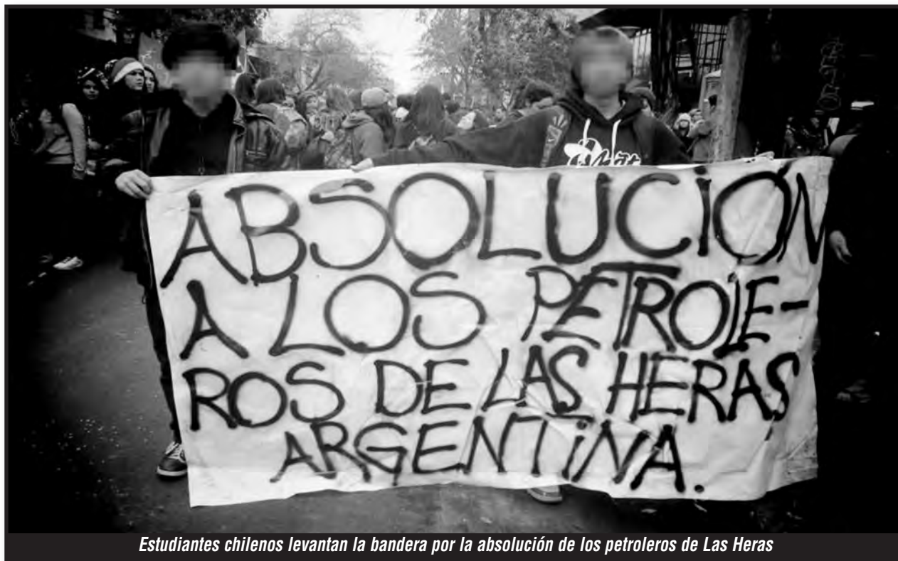
Estudiantes chilenos levantan la bandera por la absolución de los petroleros de Las Heras

Ahora bien, que rara “paz y democracia” pregonan los gorilas de la UCR: cárcel a los obreros que pelean por su salario y por su dignidad, y libertad a los antidemocráticos militares golpistas y protagonistas de la sangrienta dictadura de Videla. Nadie puede olvidar que con Alfonsín en el gobierno, fue la UCR la que aplicó la “Ley de Obediencia Debida y Punto Final”, y así fue como