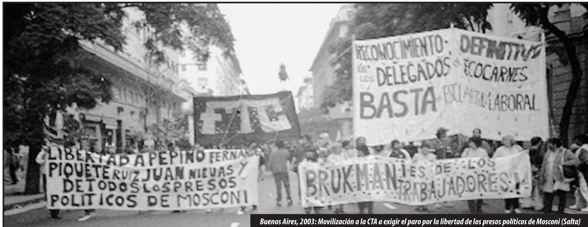
Buenos Aires, 2003: Movilización a la CTA a exigir el paro por la libertad de los presos políticos de Mosconi (Salta)

Porque así como se ponen de acuerdo para los programas electorales, por el socialismo, por la lucha de los trabajadores, etc., nada impide que esto lo podamos hacer en un gran Frente de Lucha de los obreros, en serio. Así como se hacen acuerdos electorales también se pueden hacer acuerdos prácticos, concretos de lucha. Porque los obreros necesitan pelear porque las condiciones de salario, de despidos, de desocupación están en todos lados. Entonces, las fuerzas están, nadie puede decir que no están. Bueno... de las palabras a los hechos es la cuestión.