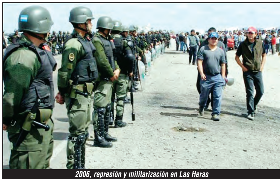
2006, represión y militarización en Las Heras

En ese Tribunal de la Venganza se quiere linchar a los trabajadores que lucharon contra el impuesto al salario y por trabajo digno ¡NO LO PODEMOS PERMITIR!