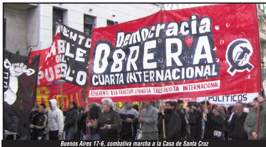
Buenos Aires 17-6, combativa marcha a la Casa de Santa Cruz

LA ABSOLUCIÓN Y LA LIBERTAD DE LOS COMPAÑEROS SE CONQUISTARÁN PONIENDO EN LAS CALLES TODO EL PESO DE LAS ORGANIZACIONES DE LUCHA EN ARGENTINA Y CON LA SOLIDARIDAD INTERNACIONAL DE LA CLASE OBRERA