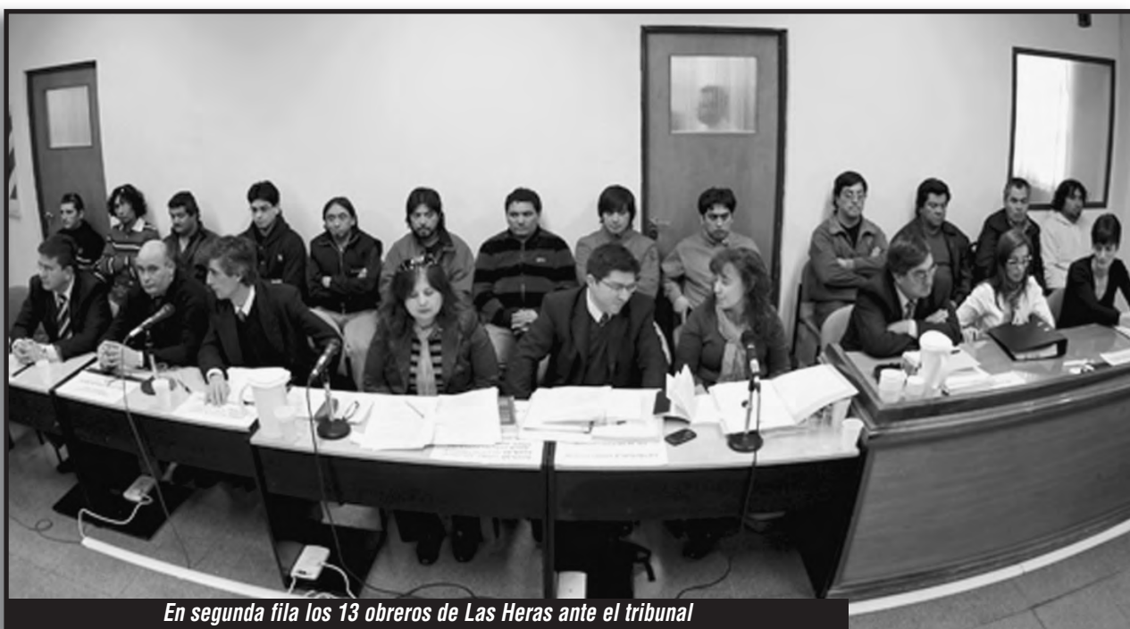
En segunda fila los 13 obreros de Las Heras ante el tribunal