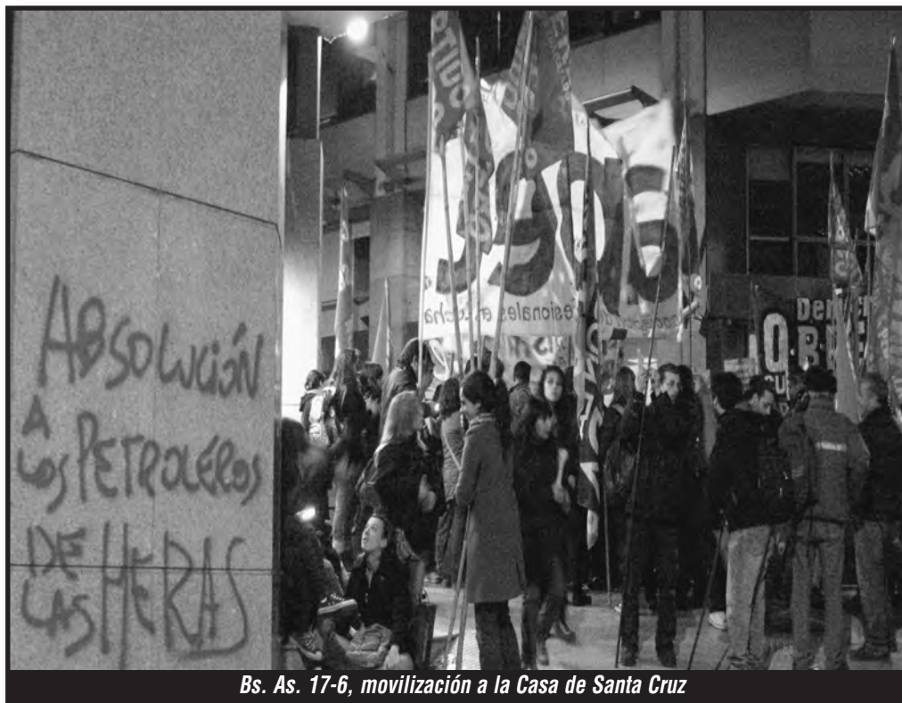
Bs. As. 17-6, movilización a la Casa de Santa Cruz

Nuestras fuerzas a nivel nacional e internacional fueron puestas 100% en la balanza de los trabajadores de Las Heras, en defensa de los 6500 procesados y de todos los obreros atacados del mundo. Las rejas cubiertas de proclamas en apoyo de los obreros de Las Heras en las caras mismas de los represores en los tribunales de la inquisición son prueba de ello. Pero no nos contentamos. Esto debe ser tan solo el inicio. Todas las fuerzas conscientes de la clase obrera mundial, desde Occupy Wall Street a los indignados de Madrid, de los piquetes de los obreros de Sudáfrica que enfrentan a la Anglo-American, se deben hacer sentir aún mucho más fuerte junto a sus hermanos de clase perseguidos en Argentina. La lucha por la libertad de los compañe-