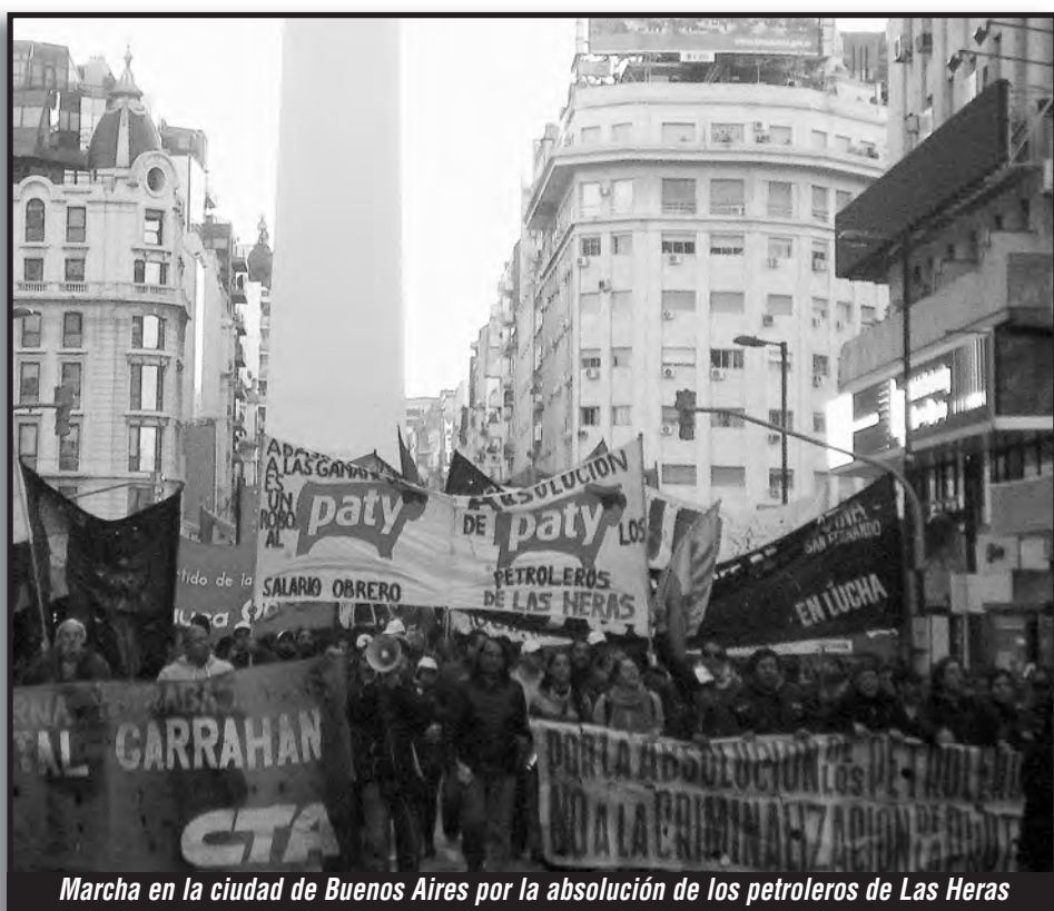
Marcha en la ciudad de Buenos Aires por la absolución de los petroleros de Las Heras