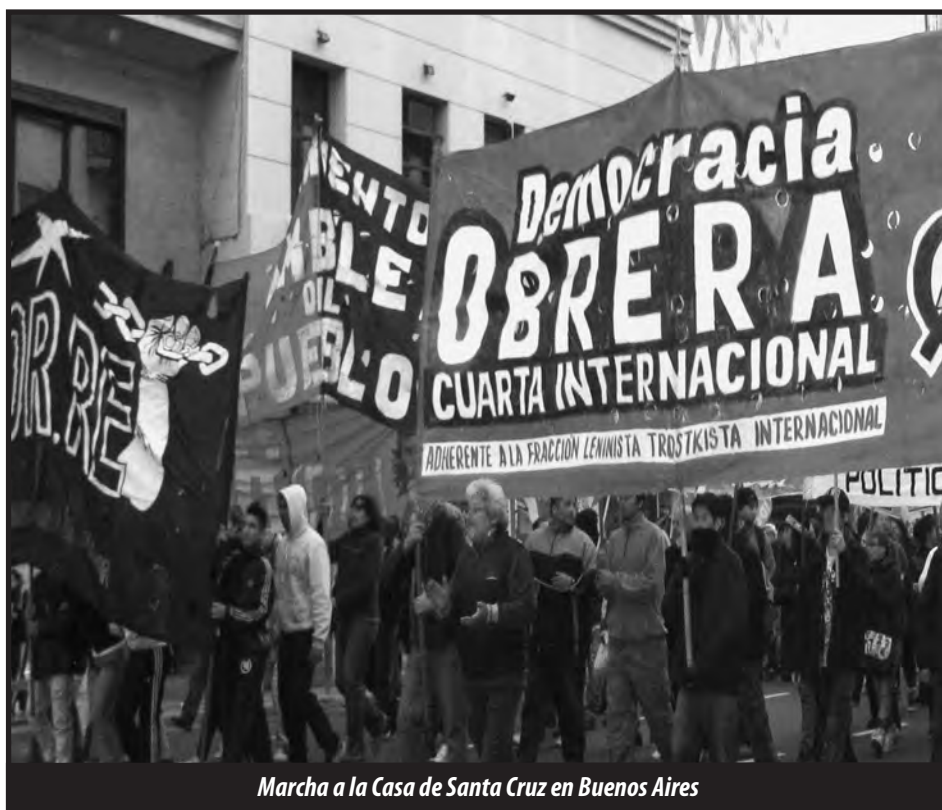
Marcha a la Casa de Santa Cruz en Buenos Aires

Las demandas por las que se levantaron los obreros y todo el pueblo de Las Heras en el 2006, son las demandas de todo el movimiento obrero hoy. La defensa de los compañeros concentra la lucha de la clase obrera contra el saqueo imperialista, contra el impuesto al salario, la precarización laboral y por la libertad de los dirigentes obreros atacados por el estado. Es por eso que las petroleras imperialistas, el gobierno de la Kirchner, la UCR y la oposición patronal, y los jueces videlistas ya tienen la sentencia contra los compañeros, porque no quieren que se generalicen estas demandas y que motoricen la lucha de la clase obrera y las masas desposeídas de la nación.