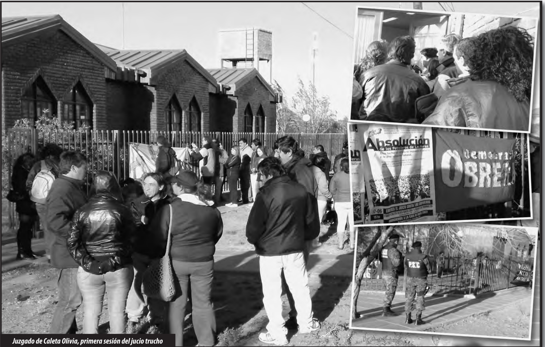
Juzgado de Caleta Olivia, primera sesión del juicio trucho