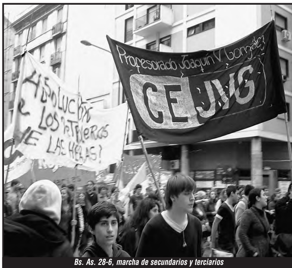
Bs. As. 28-6, marcha de secundarios y terciarios

Tampoco nada impide, salvo algún olvido al cierre de las listas, que los candidatos del FIT en Santa Cruz sean los obreros petroleros que están en el patíbulo, sus mujeres y sus hijos. Ese es realmente el Frente de Izquierda y de los Trabajadores que necesitan los explotados. ¿"Memoria, verdad y justicia"? ¿Por qué en Formosa sí y en Las Heras no, don Pérez Esquivel?