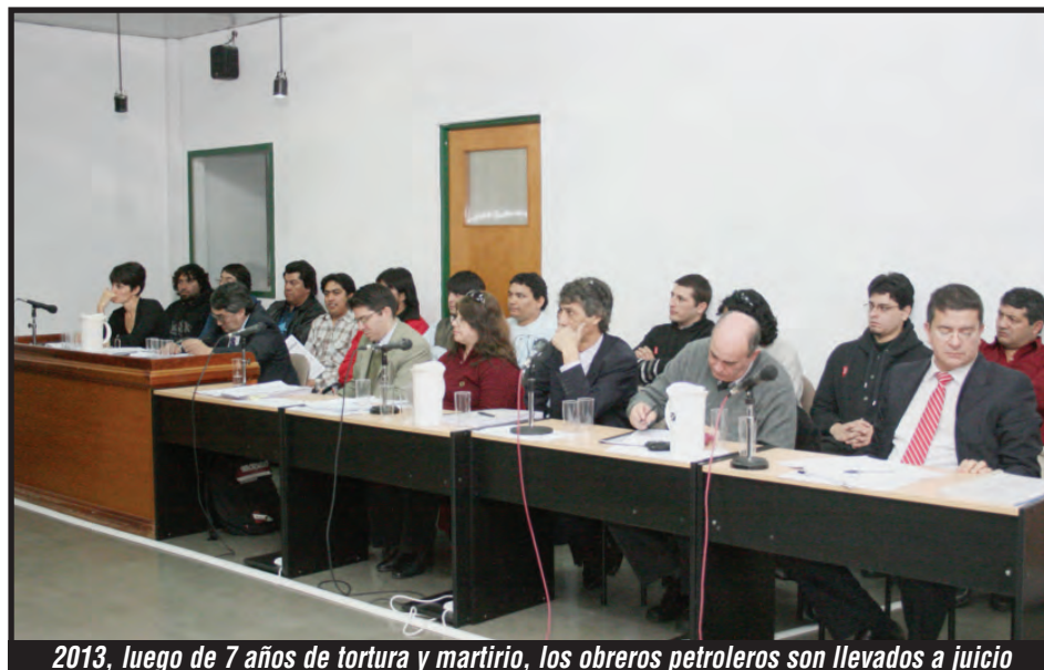
2013, luego de 7 años de tortura y martirio, los obreros petroleros son llevados a juicio

LA ABSOLUCIÓN Y LA LIBERTAD DE LOS COMPAÑEROS SE CONQUISTARÁN PONIENDO EN LAS CALLES TODO EL PESO DE LAS ORGANIZACIONES DE LUCHA EN ARGENTINA Y CON LA SOLIDARIDAD INTERNACIONAL DE LA CLASE OBRERA